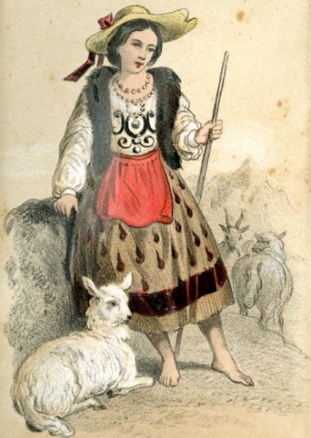
MURVIEDRO Mourviedja Ancenne Safonte