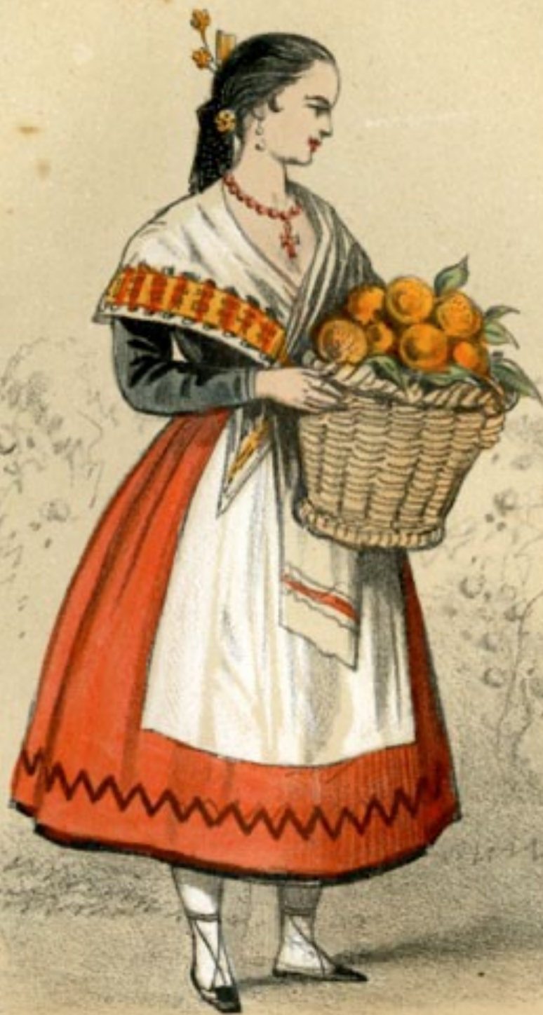
NARANJERA de Madrid