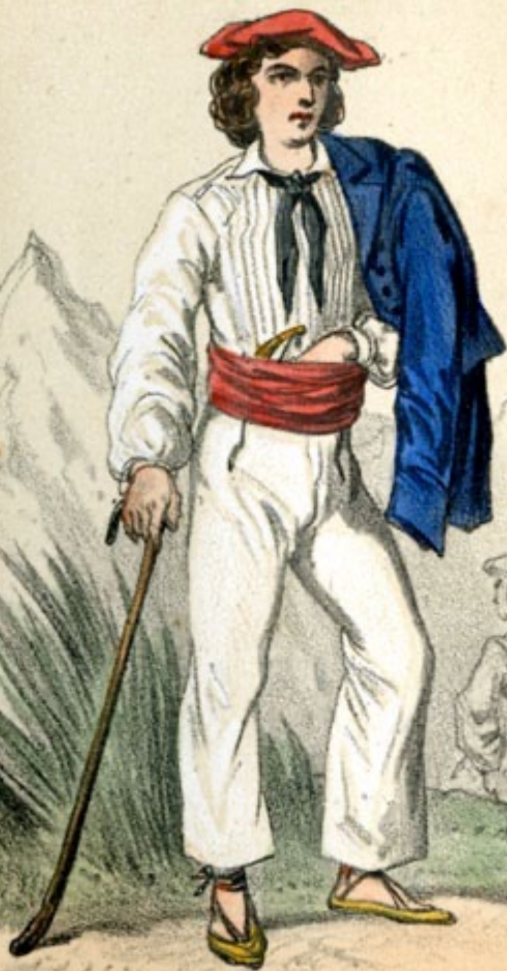
SAN SEBASTIAN. S t Sébastien.