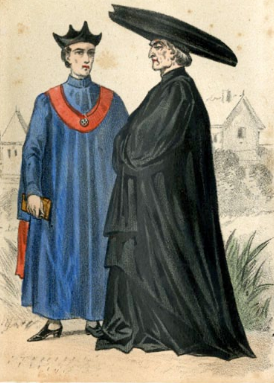
ECLESIASTICO Y SEMINARISTA. Ecclesiastique et seminariste.