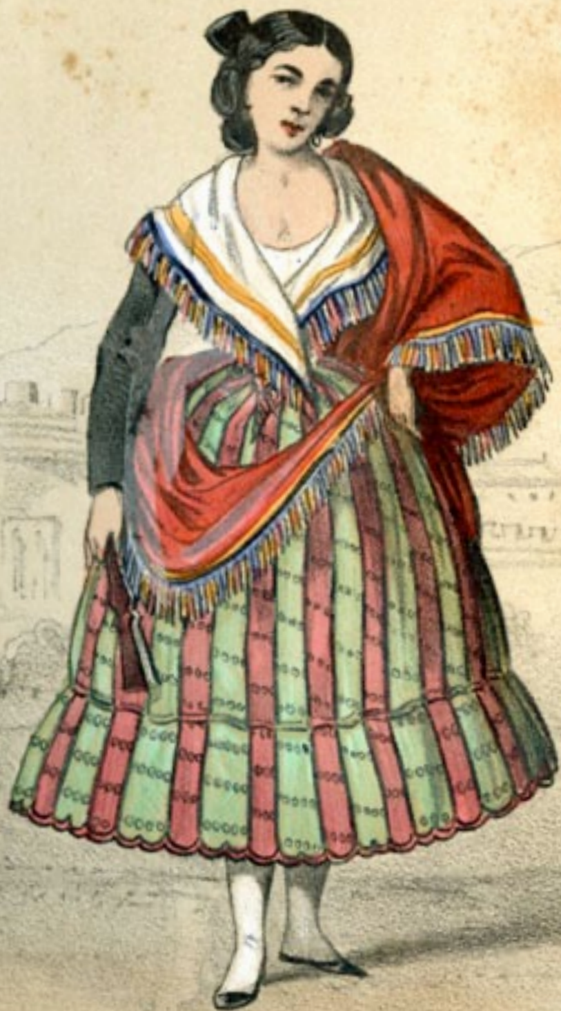
GITANA DE GRANADA.