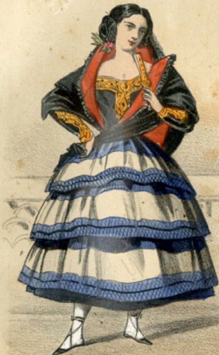
LOS TOROS EN MADRID Les Taureaux