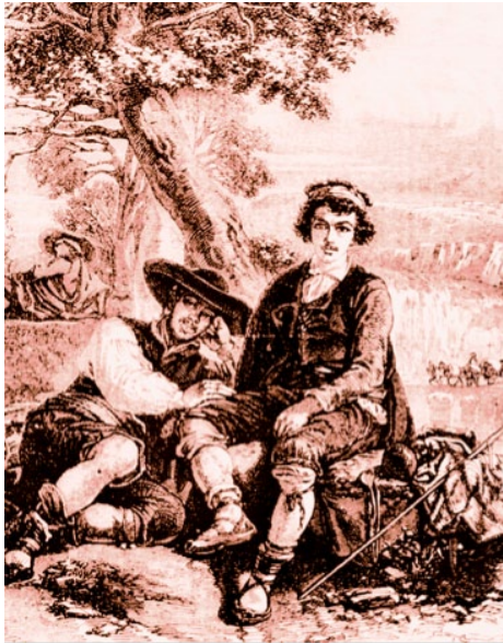
Semanario Pintoresco Español . 1 de enero de 1853 «Habitantes de las cercanías de Panticosa» A. de Laroche

Algunos de los tipos estaban tomados de re- vistas e ilustraciones de la época, como puede verse en el caso del hombre de Panticosa, copiado del Semanario Pintoresco .