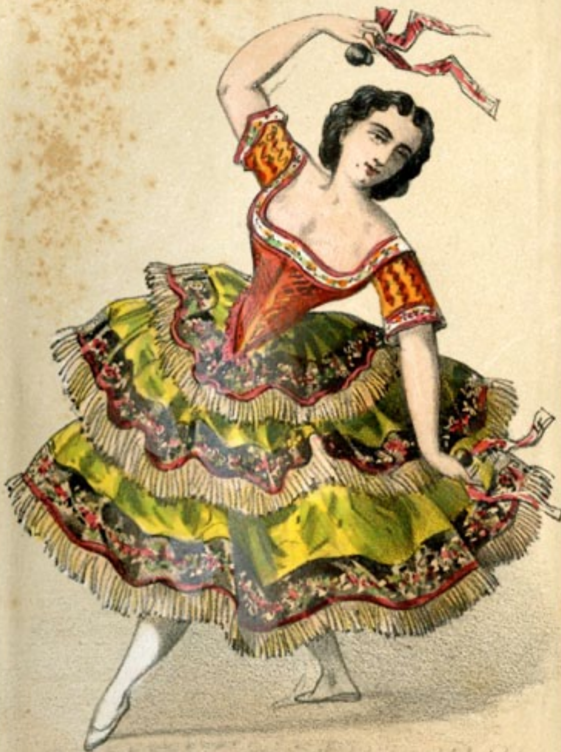
BOLERO. BOLERA Danseuse