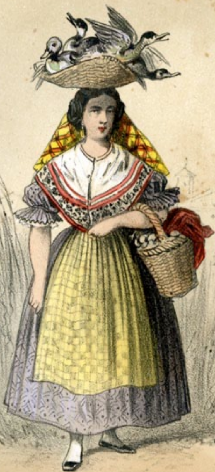
HUERTA DE VALENCIA Femme de la Campagne